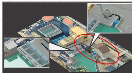
排水機場設計の3次元化