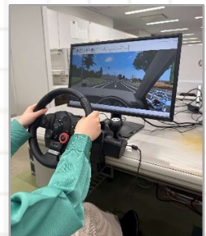
道路設計の3次元化 (VR走行シミュレーション)