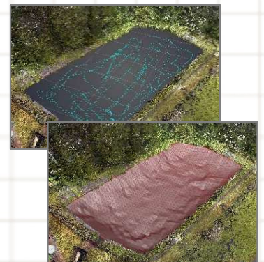
ため池の点群、三角網データ