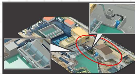
排水機場設計の3次元化