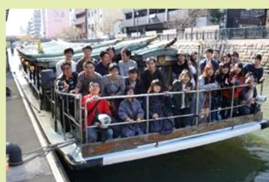
年3回ほどの若手社員の交流 若手社員のみで企画・運営（会社は支援）し、食事会などを通じて若手社員の交流の 場を設けています 新型コロナウイルス感染症が拡大している期間は中止としました