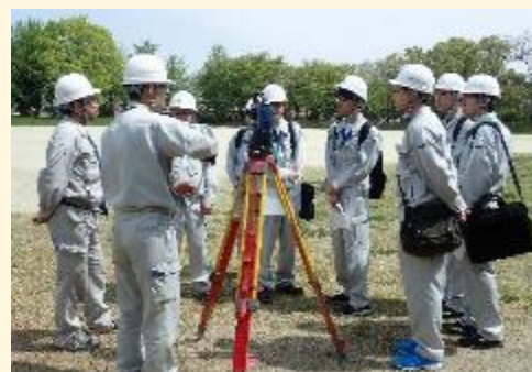
社内研修の講師として 若手設計技術者の社内測量実習研修の講師を 担当し、若手設計技術者の技術力向上に貢献 しています