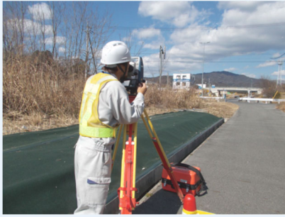
基準点測量 (測量実施の基礎となる 基準点の位置を定めます)