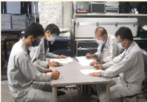
社内研修 技術部門と連携した研修のほか、豊富な研修 メニューにより実務能力の向上を図ります