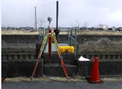
GPS測量 (人工衛星からの電波を受信・解析し 位置を図るシステム)