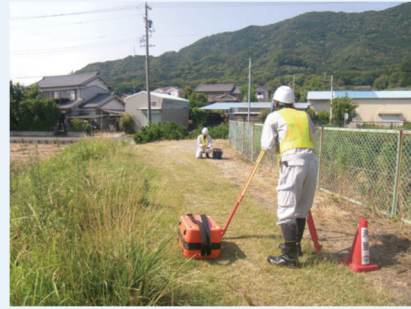
路線測量 (中心線測量、縦断・ 横断測量、仮BM 設置測量)