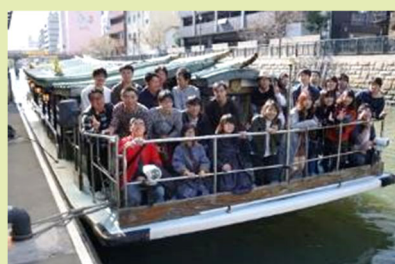
年3回ほどの若手社員の交流 若手社員のみで企画・運営（会社は支援）し、食事会などを通じて若手社員の交流の 場を設けています 新型コロナウイルス感染症が拡大している期間は中止としました