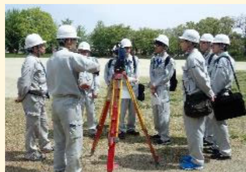
社内研修の講師として 若手設計技術者の社内測量実習研修の講師を 担当し、若手設計技術者の技術力向上に貢献 しています