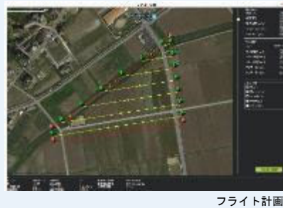
測量用ドローンによる三次元図面の作成 (ドローンにより測定した数値データを解析し、三次元図面を作成します)