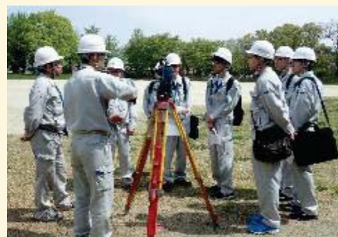
社内研修の講師として 若手設計技術者の社内測量実習研修の講師を 担当し、若手設計技術者の技術力向上に貢献 しています