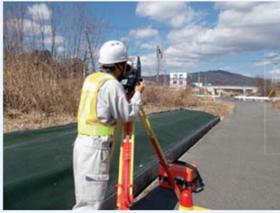
基準点測量 (測量実施の基礎となる 基準点の位置を定めます)