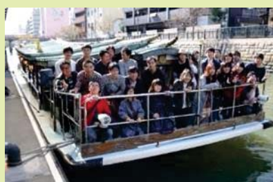
年3回ほどの若手社員の交流 若手社員のみで企画・運営（会社は支援）し、食事会などを通じて若手社員の交流の 場を設けています 新型コロナウイルス感染症が拡大している期間は中止としました