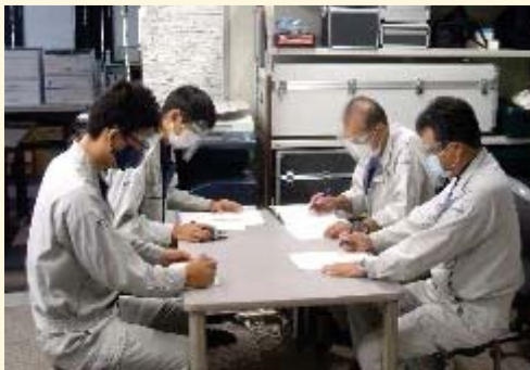
社内研修 技術部門と連携した研修のほか、豊富な研修 メニューにより実務能力の向上を図ります