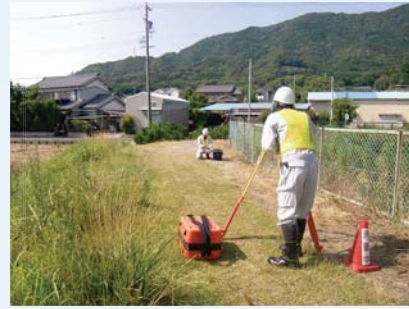
路線測量 (中心線測量、縦断・ 横断測量、仮BM 設置測量)