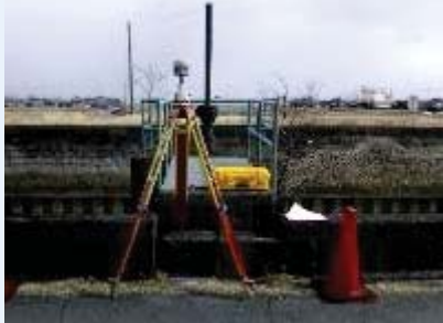
GPS測量 (人工衛星からの電波を受信・解析し 位置を図るシステム)