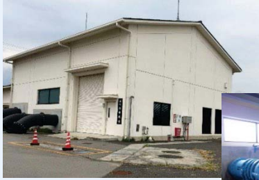
排水機場（防災施設）