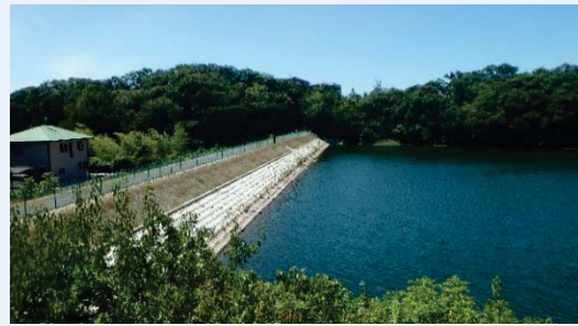
ため池（老朽ため池を地震等に耐えられる構造に改修します）