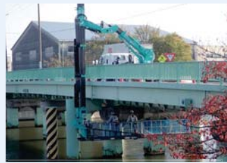
橋梁（橋梁点検調査）