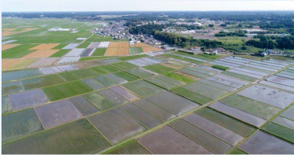
ほ場整備（田の区画を大きくして営農の効率化を図ります）