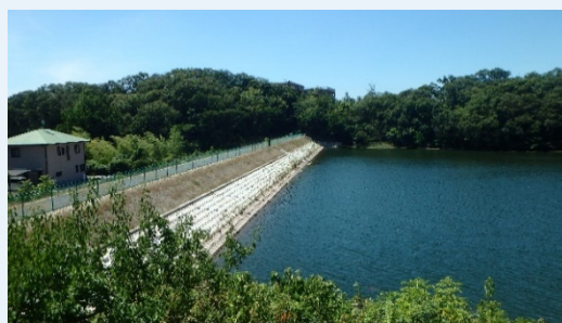
ため池（老朽ため池を地震等に耐えられる構造に改修します）