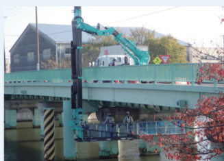
橋梁（橋梁点検調査）