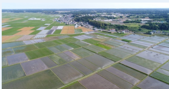
ほ場整備（田の区画を大きくして営農の効率化を図ります）