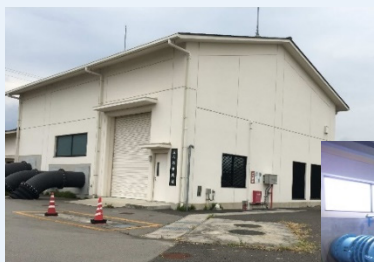
排水機場（防災施設）